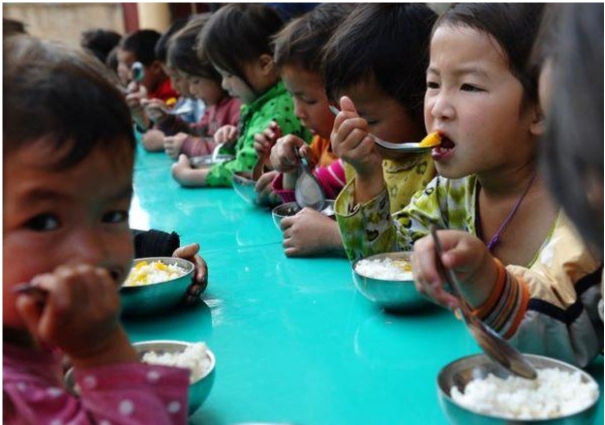
Trẻ người H'mong ăn cơm trưa miễn phí ở nhà trẻ tại Mèo Vạc, tỉnh Hà Giang năm 2015 (minh họa).