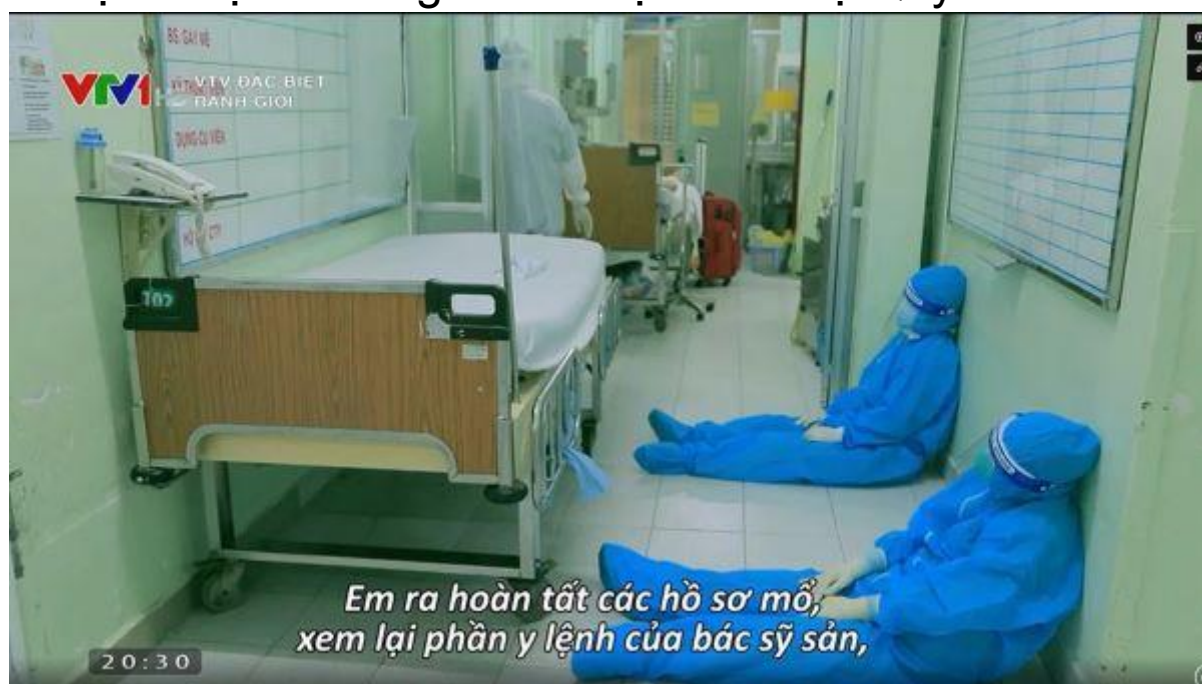
Ảnh: Một cảnh trong film Ranh giới.

Ngành truyền hình VTV 1 đã tái hiện sự hy sinh cao cả ấy trong bộ phim thời sự tài liệu Ranh giới của đạo diễn Tạ Quỳnh Tư.