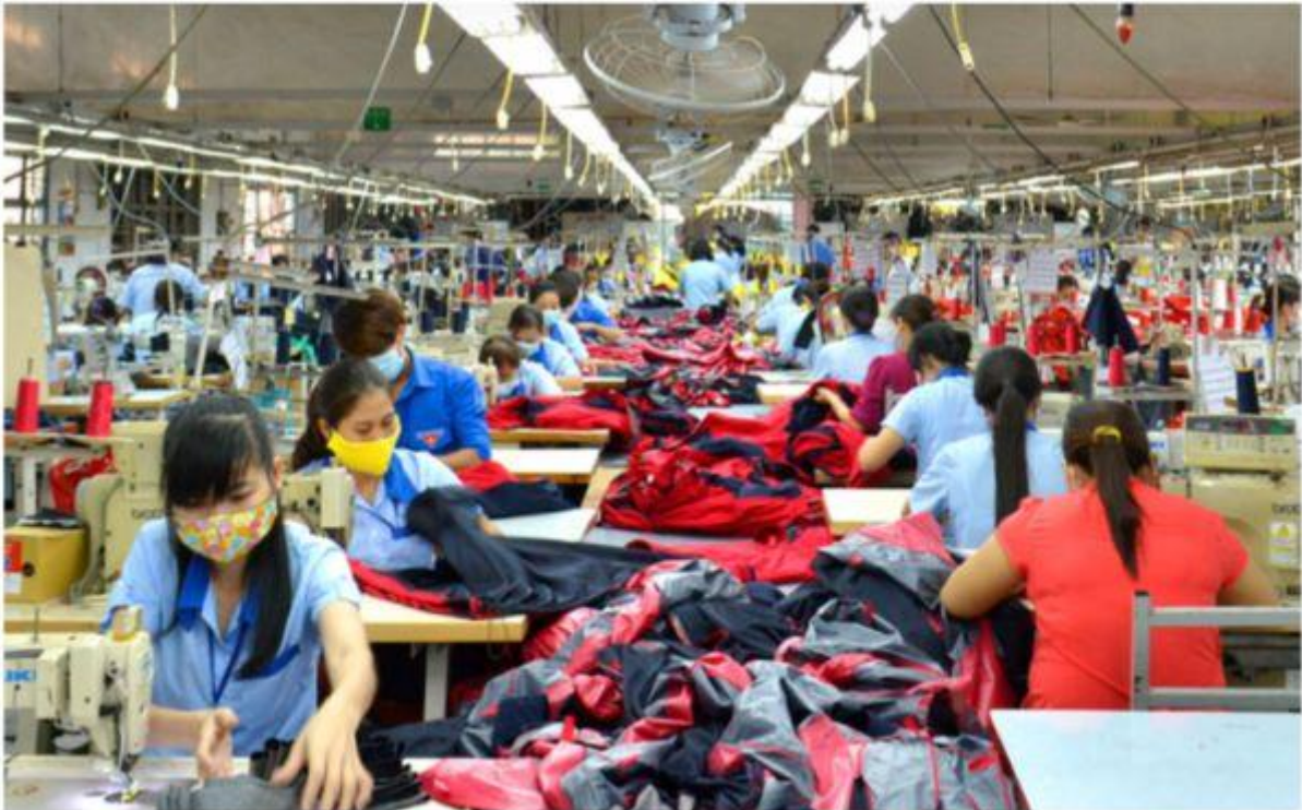
Doanh thu dệt may sụt giảm vì vắng bóng đơn hàng

Trong quý 3-2023, một công ty dệt may từng rất lớn ở TP.HCM không ghi nhận đơn hàng nào. Khoản doanh thu ít ỏi có được đến từ dịch vụ.