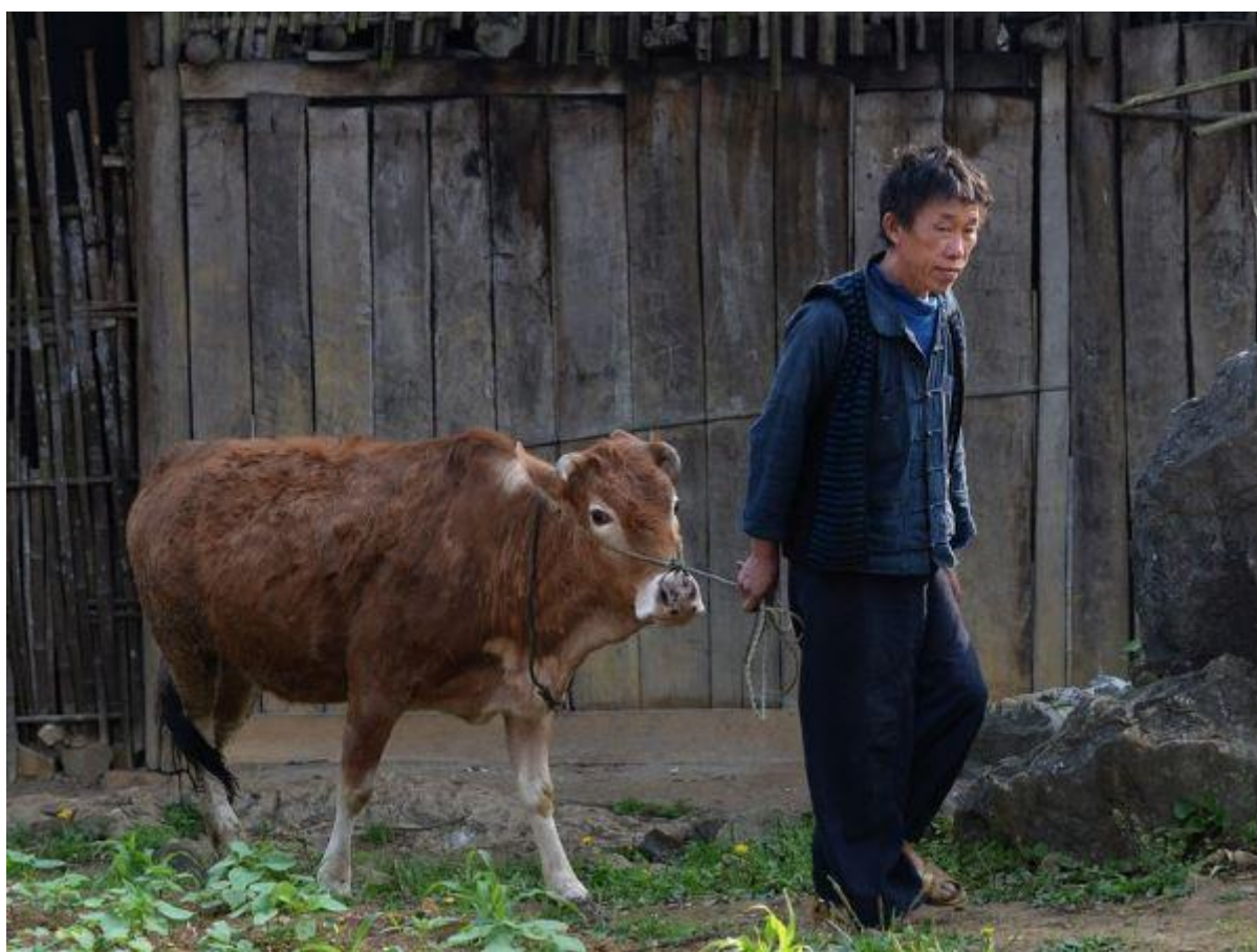
Người đàn ông dân tộc H'mong dắt con bò từ nhà ở Mèo Vạc, Hà Giang. AFP

-Năm 2022: Tổng cục Dự trữ Nhà nước cho biết năm 2022 đã xuất cấp tổng cộng 14.000 tấn gạo hỗ trợ cứu đói dịp Tết Nguyên đán năm 2022 cho 16 tỉnh. Số gạo hỗ trợ cứu đói giáp hạt đầu năm 2022 là 10.370 tấn cho 17 tỉnh (báo Nhân dân).