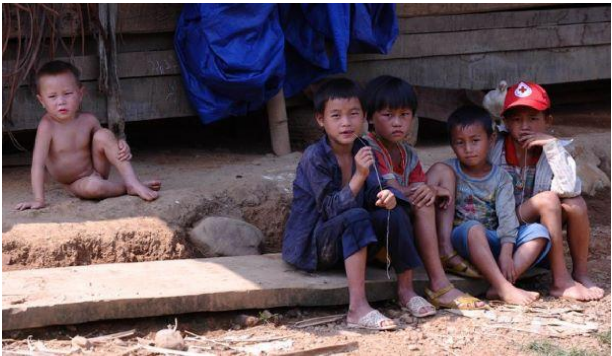
Trẻ em người Hmong ở làng Huoi Khon, Mường Nhé, tỉnh Điện Biên năm 2011 (minh họa).

Nghèo đến nỗi đều đều mỗi năm vài tháng phải đi xin gạo cứu đói của Chính phủ và các Mạnh Thường Quân, kéo dài vài chục năm nay thì gọi là gì?