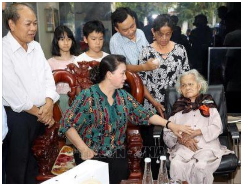
Ảnh: Lại là cù bà... được Chủ tịch Quốc hội Nguyễn Thị Kim Ngân thăm và tặng quà Mẹ Việt Nam anh hùng năm 2020.

Bà càng đóng càng phiêu Lừa được luôn Quốc hội Khiến Nguyễn Thị Kim Ngân Vờ cầm tay thăm hỏi