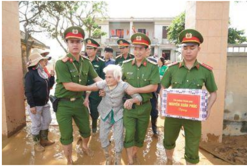
Ảnh: Cù già đang “đóng phim” chạy lũ.