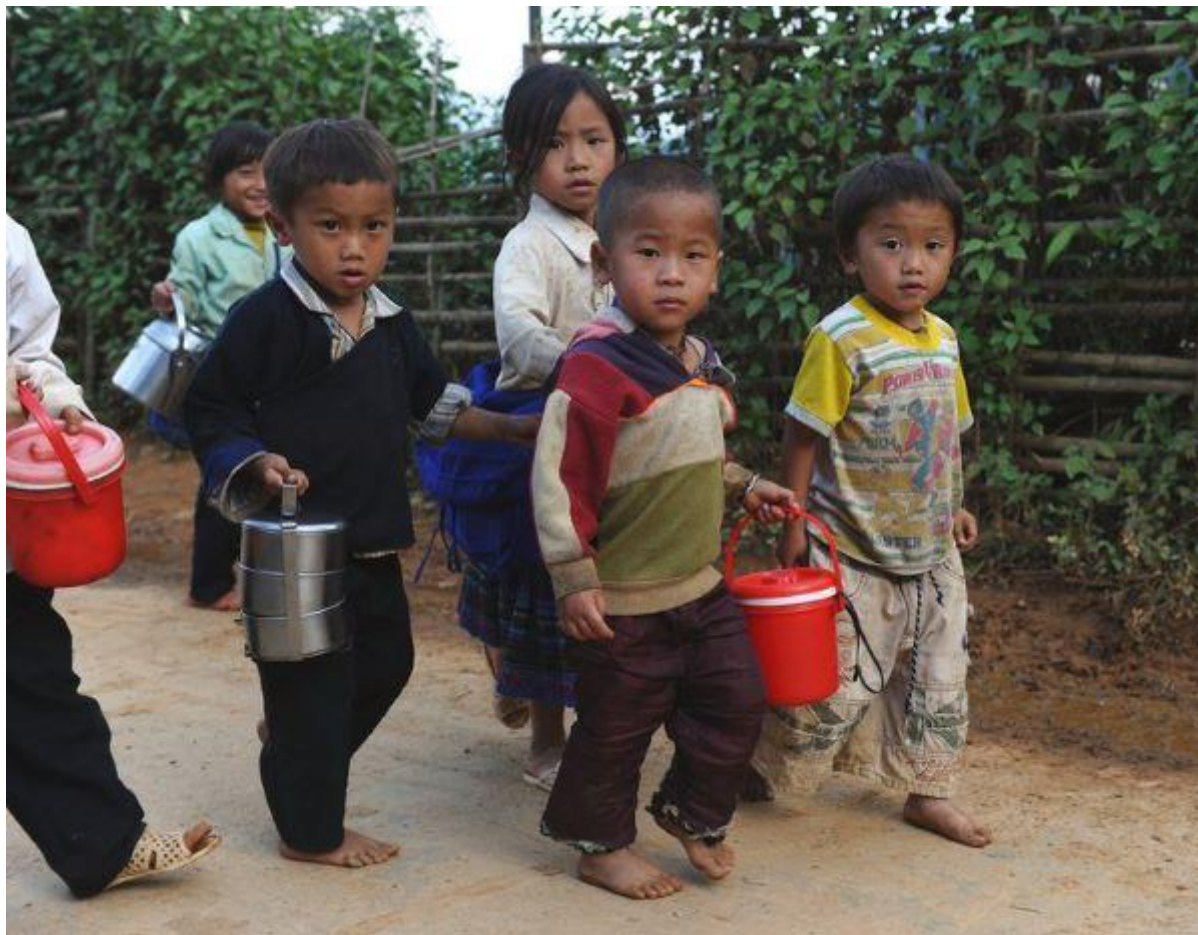
Trẻ em người H'mong mang các hộp đựng cơm trưa đã ăn từ trường về nhà ở huyện Mù Cang Chải, tỉnh Yên Bái năm 2012 (minh họa).