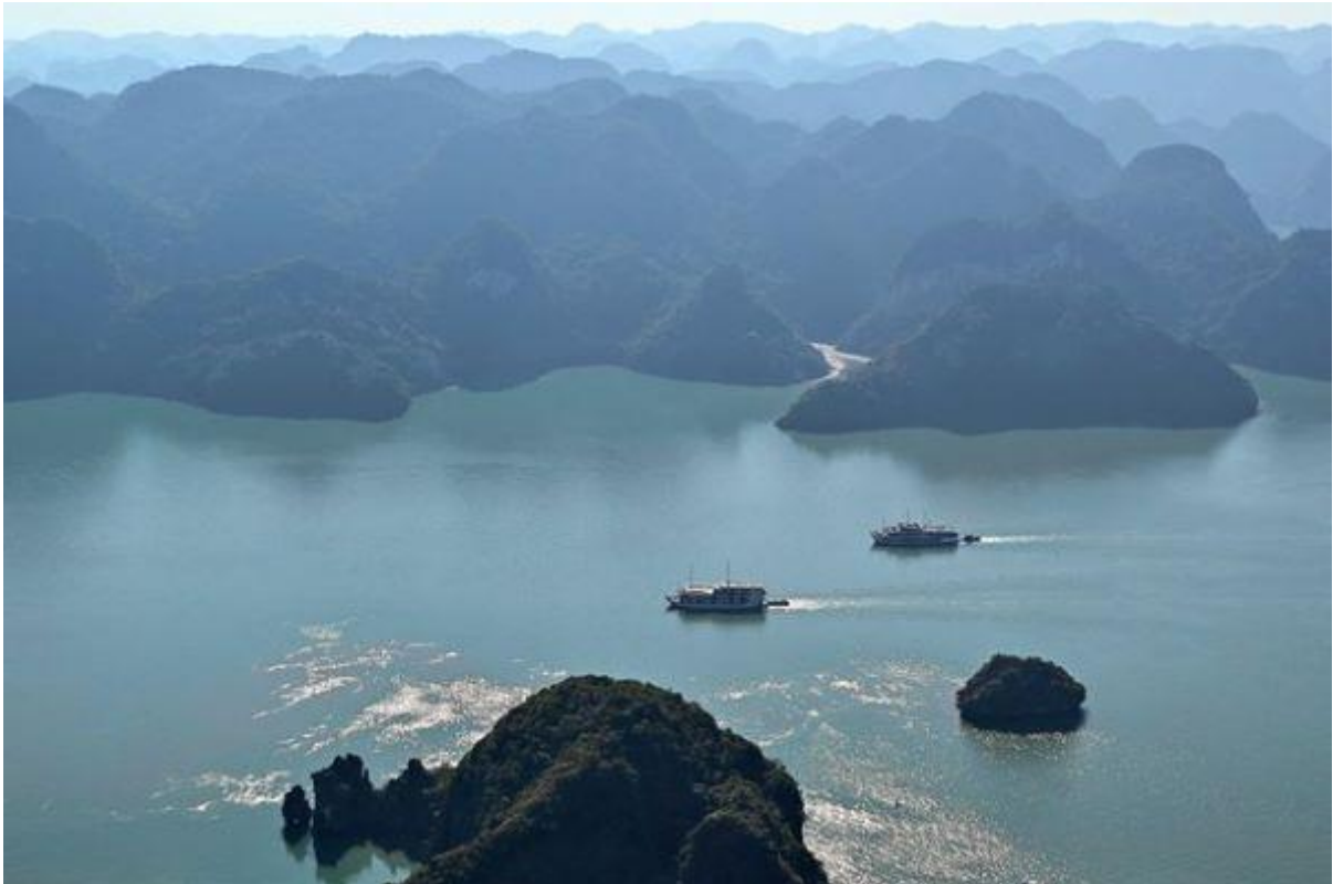
Ảnh chụp Vịnh Hạ Long ngày 28/12/2023.

Vịnh Hạ Long của Việt Nam đang đánh mất sắc thái trong xanh khi mà tình trạng ô nhiễm và phát triển quá mức đe dọa đến sinh vật tự nhiên cũng như hình ảnh đẹp hoàn hảo của Vịnh.